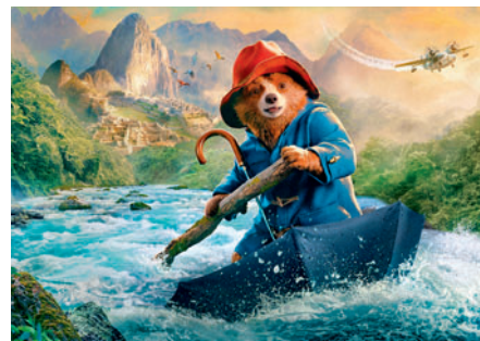
Paddington v džungli