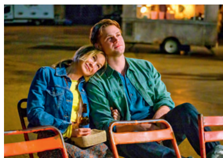
Bridget Jonesová: Láskou šílená