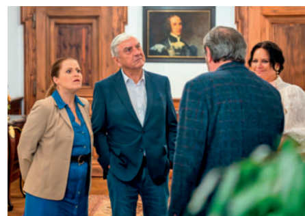
Jak se nám to mohlo stát?