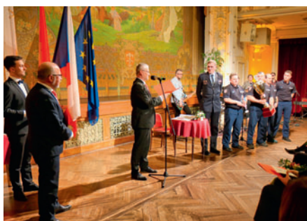
25. 3. Ceny města Litomyšl za rok 2024