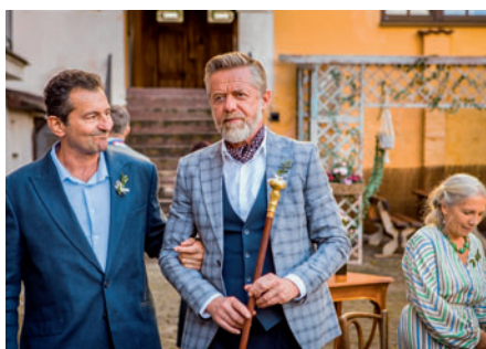
Moře na dvoře