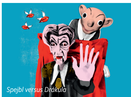
Spejbl versus Drákula

Oblíbené loutkové divadlo Spejbla a Hurvínka přináší skvost ze svého Zlatého fondu – legendární muzikál „Spejbl versus Drákula“. Tato inscenace, která měla premiéru již v roce 1974, patří k tomu nejlepšímu, co v dlouhé historii divadla vzniklo. A dodnes se těší neutuchajícímu zájmu