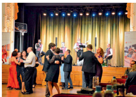
25. 1. Benefiční Adfors basket ples