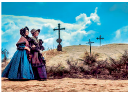
11., 12. 1. Nosferatu