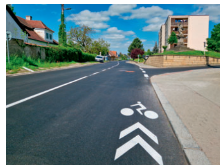
Komunikace a chodníky v ulici Na Lánech