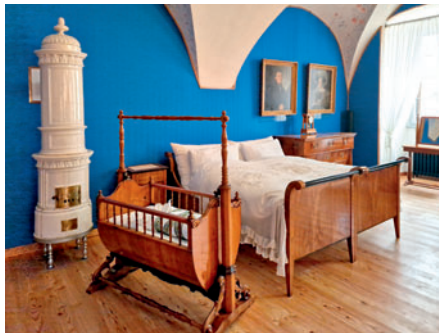
Rodný byt Bedřicha Smetany

nou položkou bylo také rozšíření městské kompostárny za téměř 6 milionů korun i zde město očekává dotaci ve výši 3,2 milionů korun. První fáze rekonstrukce sportovního areálu Černá hora za téměř 6 milionů korun nebo oprava střechy a krovů Smetanova domu za 15 milionů korun – tato položka představuje náklady pouze na první etapu, která proběhla o letních prázdninách uplynulého roku. Oprava střech SD bude pokračovat na jaře letošního roku. Stejně tak je tomu s projektem rekonstrukce stadionu, který bude v roce 2025 pokračovat. Významnou kapitolou investic do péče o městský majetek jsou každoročně také opravy vodovodu a kanalizace, které v roce 2024 stály 22,5 milionů korun. Tento rozsah péče o údržbu vodovodní a kanalizační sítě vyplývá