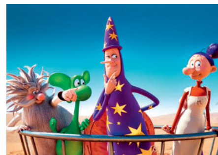
18., 19. 1. Hokus pokus diplopokus