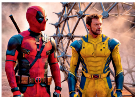
26., 27. a 28.7. Deadpool & Wolverine