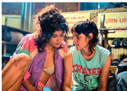
21.7. Zatracená krvavá láska