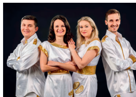
16. 7. Abba Symphonic Show