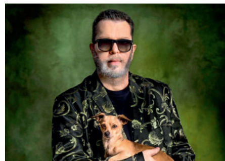
8. 8. Richard Müller - 40 let na scéně