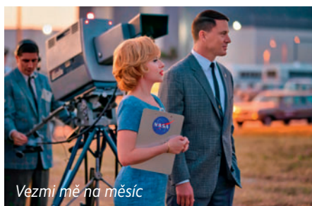
Vezmi mě na měsíc

Úspěch této mise by znamenal vítězství vesmírného závodu nad Sovětským svazem, prezident Spojených států proto usoudí, že je třeba si připravit i záložní plán v případě neúspěchu – fingované přistání. Dvě herecké hvězdy se setkávají také v dlouho očekávané akční komiksově adaptaci Deadpool a Wolverine a nepůjde o nic menšího než záchranu vesmíru, jehož zkázu je schopný odvrátit pouze Wade Wilson alias Deadpool (Ryan Reynolds). Na svou stranu ale nejprve potřebuje získat Wolverina (Hugh Jackman), kterého nový úkol ale příliš netěší. Pro milovníky katastrofických filmů připravujeme Twisters o lovcích tornád, na své si přijdou také fanoušci westernu s filmy Horizont: Americká sága a Až na konec světa. Druhý jmenovaný je navíc zahajovacím filmem letošního 58. mezinárodního filmového festivalu v Karlových Varech. Z alternativnější nabídky uvedeme filmy Zatracená krvavá láska nebo MaXXXine a nadšence do japonského anime uspokojí sportovní Blue Lock the Movie – Episode Nagi. Děti se v červenci mohou těšit