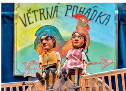
12. 7. Větrná pohádka