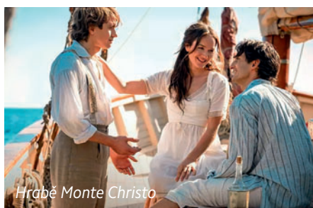
Hrabě Monte Christo

Z české produkce se můžete těšit na předpremiéru snímku Zápisník alkoholičky, který nabídne dramatický zápas mladé maminky (Tereza Ramba) se závislostí na alkoholu i o svou rodinu. Možné odlehčení nabídne snímek Vezmi mě na měsíc. Tato hvězdně obsazená komedie (Scarlett Johansson, Channing Tatum, Woody Harrelson) umožní nahlédnout do zákulisí americké agentury NASA, právě v době chystané mise přistání na měsíci.