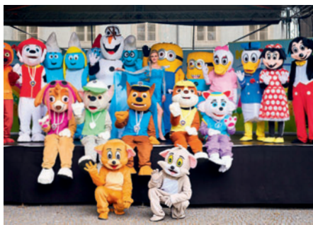
3. 8. Kinderland Festival Litomyšl 2024