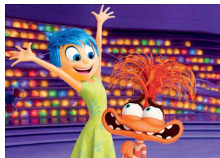
18. a 19.7. V hlavě 2