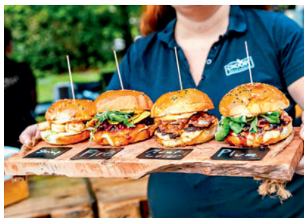
20. a 21. 7. Burger Street Festival