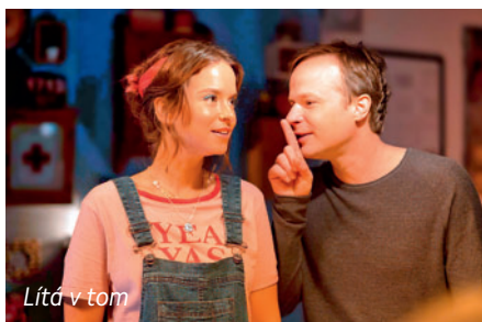
Litá v tom

A jaké filmy vám Kinematograf letos přiváží? Ve čtvrtek 1. srpna se můžete těšit na romantickou komedii Litá v tom . V pátek 2. srpna vás zveme na česko-slovenskou komedii Nikdy neříkej nikdy s oblíbenou Terezou Kostkovou a Tomášem Maštálírem v hlavních rolích. V sobotu 3. srpna se pak stanete svědky pokračování neuvěřitelného příběhu psa Gumpa, který osobně dorazí film uvést se svým páničkem, spisovate-