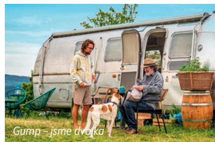
Gump - jsme dvojka

lem a scénáristou Filipem Rožkem. Název předposledního promítaného filmu Kinematografu v neděli 4. srpna je zatím tajemstvím, které včas odhalíme. Kinematograf se pak s Litomyšlí rozloučí v pondělí 5. srpna pohádkou pro nejmenší Princezna na hrášku .