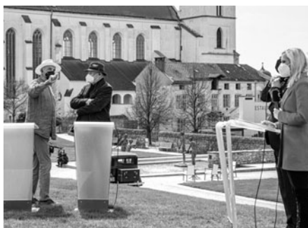
V Klášterních zahradách natáčela kromě našeho štábu i Česká televize. Povídání o Lázních ducha, ale i dalších akcích můžete najít v archivu ČT24, vysíláno bylo v neděli 25. dubna.