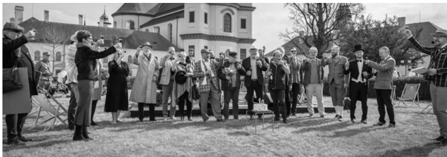
Na narozeninové oslavě nechyběl ani krásný dort a slavnostní přípitek. Lázeňským elixírem se připíjelo na lázně i (b)lázně, na lásku i přátelství, na smysl pro humor a recesi i na léčivé účinky radosti ze života a samozřejmě na brzkou shledanou.