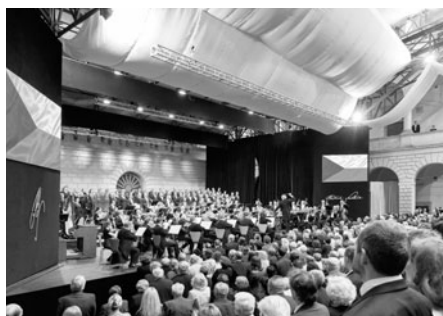
Slavnostní zahajovací koncert