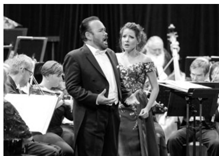
Hvězdy operního nebe – Javier Camarena & Leticia de Altamirano