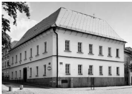
Dům čp. 194.