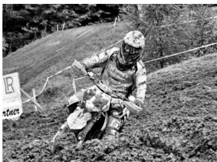
Mistrovství republiky ve Vranově.