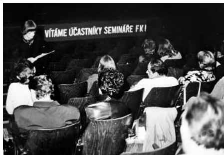
První seminář Filmového klubu Litomyšl v roce 1987.

■ Stříteský: Když jsme byli velkým klubem, že se o nás mluvilo po celé republice, tak jsme začali pořádat odborné programovací semináře, kam se sjíždělo