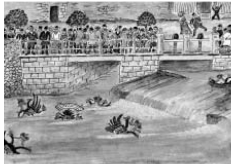
Rakouské znaky naházené do Loučného