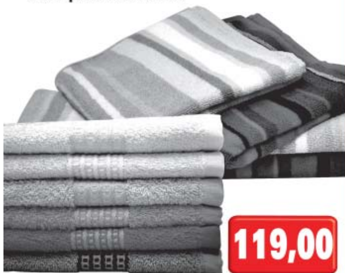
Osuška jednobarevná 50x90cm nebo pruh 70x140cm