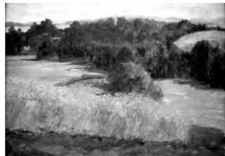
Karel Holce: Nad Osickým rybníkem, 1939, olej, lepenka, 34x45 cm, soukromá sbírka.