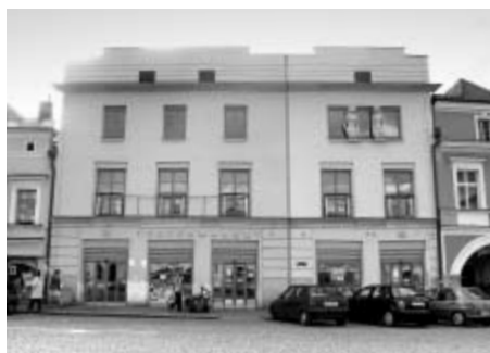
Domy čp. 70 a 71