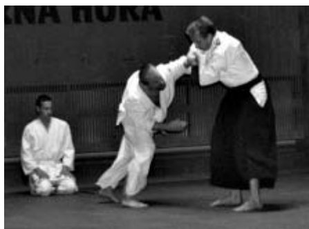
Ukázka aikido v podání litomyšlského oddílu

karatistická sezóna, připravuje se mistrovství republiky. Litomyšlský oddíl se bude účastnit