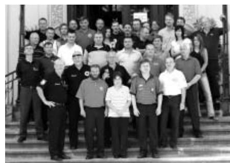
Účastníci turnaje před Lidovým domem