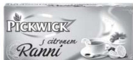
Čaj Pickwick 43,7g Ranní, ranní s citronem