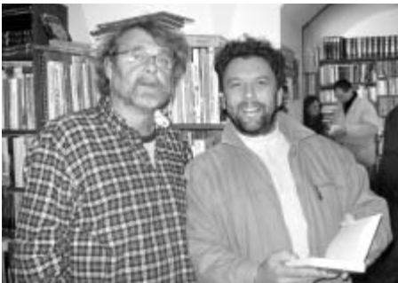
Spisovatel Petr Šabach (vlevo) s jedním ze svých čtenářů.