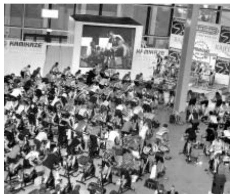
Účastníci největší spinning akce v republice Spinning Vuelta Ride 2006 v Brně. Nechyběli ani Litomyšlští...