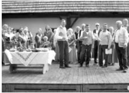
Z vystoupení litomyšlských pěveckých sborů na Veselém kopci u Hlinska